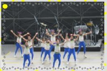
沖縄セルラースタジアム那覇では、カチューシャがはずれてしまうハプニングもありましたが、最後まで踊りぬきました。

したステージが繰り広げられ、ビュウリースも、赤いかわいい角の付いたカチューシャや、黒い襟、白い天使の羽等で仮装して出演しました。(いつもと違っちゃって小悪魔なビュウリースでした。)また、メンバーの中には数人が、児童館でのダンスレッスン(10月31日(土))開催を一覧になった方はおわかりになりましたか?