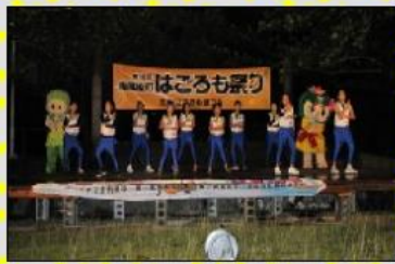
平成27年10月10日(土)お天気が心配された第14回南風原町はごろも祭りですが、雨雲を吹き飛ばし無事に宮城公園で開催されました。

10月のビュウリースは、町内の「はごろも祭り」(宮城公園)と、町外の「しあわせコンサート」(沖縄セルラースタジアム)に出演しました。町内のお祭りは、各字に向いてビュウリースを身近に感じてもらえる良い機会です。今年はいくか所のお祭りに参加しましたが、町外での出演は年間1回程度しかなく、今年度は今回が初めてでした。「しあわせコンサート」はコンテスト形式だったため普段同じステージに立つ機会のない他の教室のダンスキッズ達も出場していて、とても刺激になりました。また今回は、ハロウィンをテーマにした衣装やメイクで趣向を凝ら